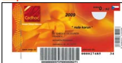
DÁRKOVÝ KUPÓN CADHOC